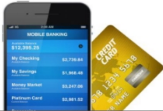
モバイルバンキングと決済