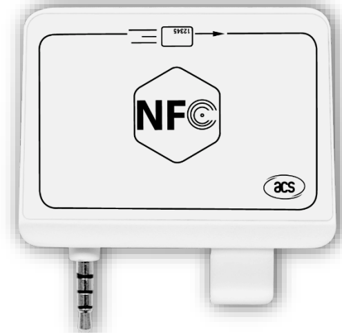
ACR35 NFC MobileMate