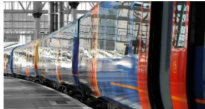
トランスポーテーション