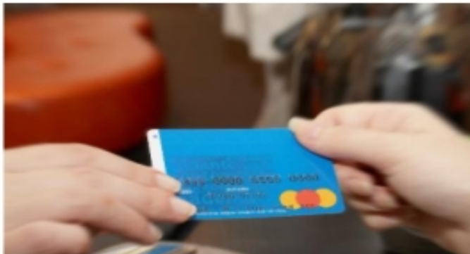
ロイヤルティプログラム